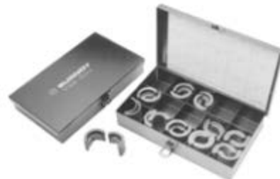
Caixa para Matrizes "U" # PT29291, comporta até 15 matrizes